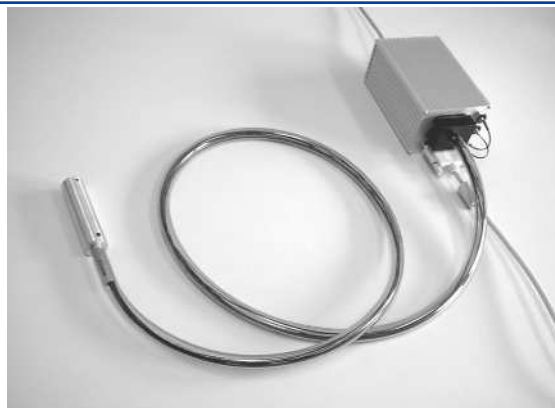
Feldanalyse-Pyrometer: Messkopf, faseroptischer Bildleiter und Auswerteelektronik

Mit Hilfe der Zielmarkierung kann das Feldanalyse-Pyrometer auf das gewünschte Beobachtungsfeld ausgerichtet werden.